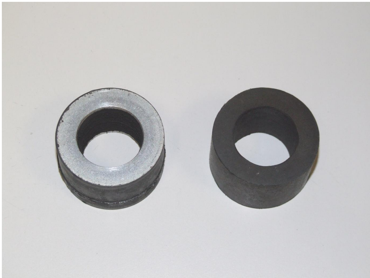
Bild 1: Bugradgummi mit vulkanisierten Metall-Endscheiben altes Bugradgummi (zu ersetzen)